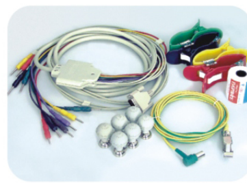
Accesorios de alta calidad