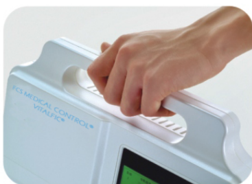
Compacto, diseño ligero y portable